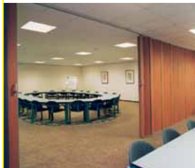
Skládací stěny a mobilní příčky