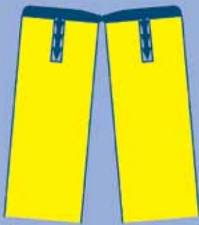
Page 110, 150, 150 Glass

Page 150 má širší panely než Page 110. To znamená, že tato skládací příčka zabírá i méně místa ve složeném stavu. Stylový skládací systém Vám umožní ozdobit Váš interiér vkusně a velmi prakticky.