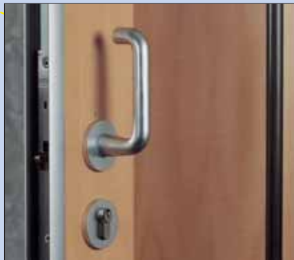
Stor låstokk og sylindrelås.