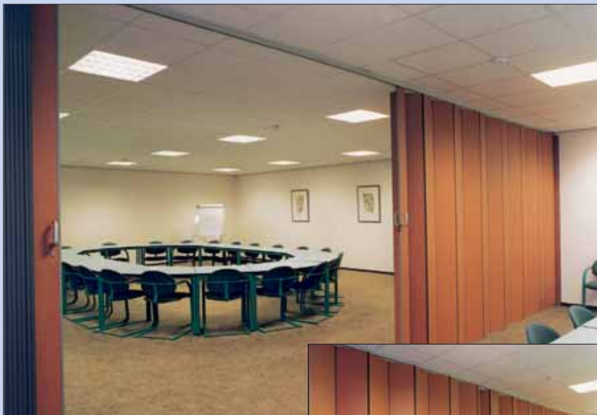
Mono, tofløyet. (Åpner til begge sider)

Låsstokken til Mono har en enkel nøkkellås. Som et alternativ kan Mono leveres med større låstokk og sylindrelås.