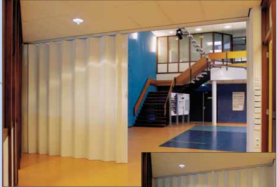
Mono, enfløyet. (Lukker til en side)

Parthos innestår for solid håndverk og kvalitet. (ISO 9001 sertifisert)